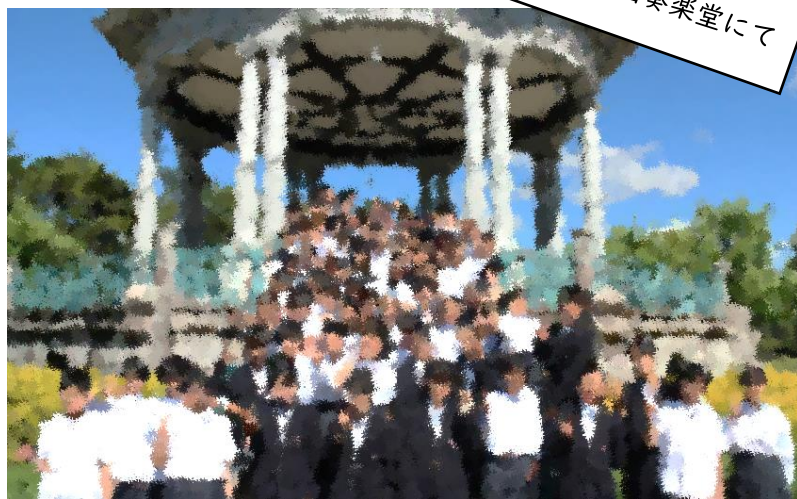
鶴舞公園奏楽堂にて

5月8日(水)5・6時間目に鶴舞公園オリエンテーリングを行いました。当日は、晴天に恵まれ、校外学習日和となりました。全員で奏楽堂まで行き、そこから班ごとに出発し、鶴舞公園を探索しながら、各所にある数々のお題をクリアしていきました。この活動の中で、「宝探し」(仲間のいいところ探し)をし、仲間の新たな一面を見ることができたように感じます。ぜひ、普段の学校生活でも「宝探し」をしてみてください。